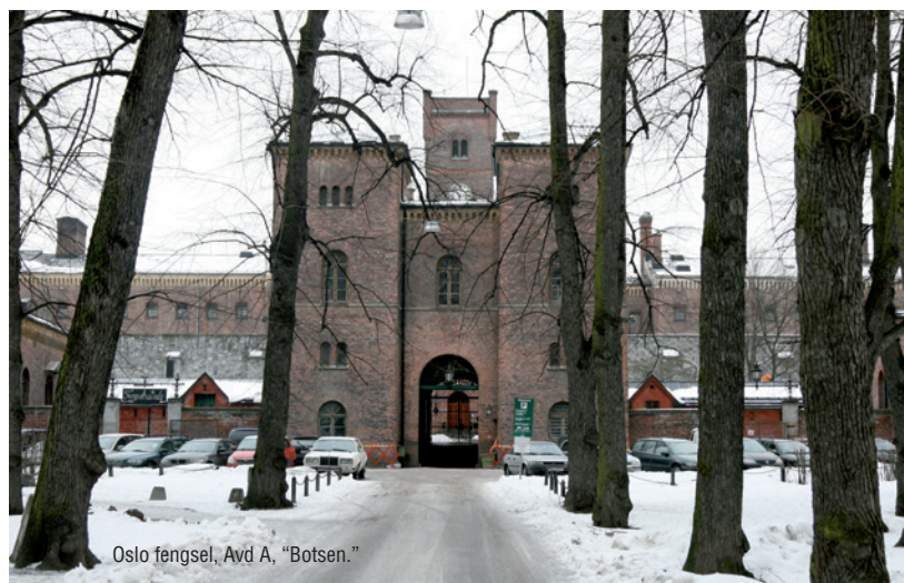
Oslo fengsel, Avd A, "Botsen."

Programmet består av tett oppfølging av reflektanter i arbeidspraksis i Maritastiftelsens bruktbuikk. I 2014 har 2 kvinnelige reflektanter hatt tilbud om arbeidspraksis og utvidet oppfølging på Maritabutikken, i kortere og lengre periode. De fleste deltakerne har arbeidet et par dager ukentlig i butikken og hatt ca