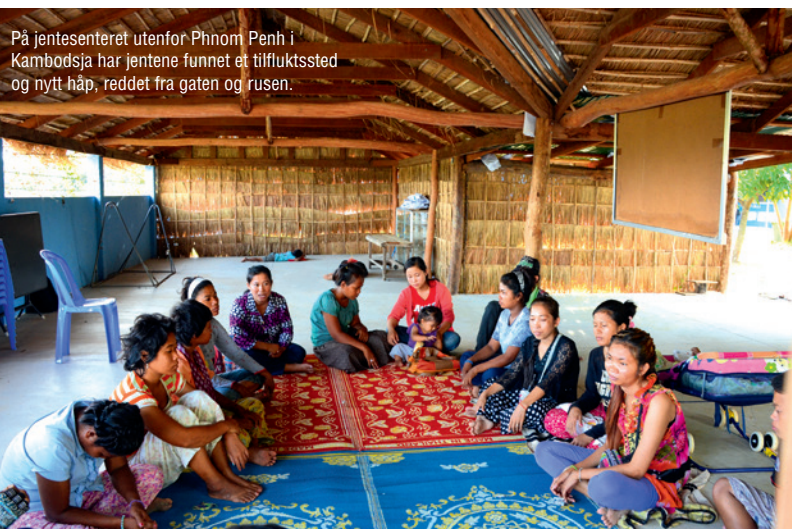
På jentesenteret utenfor Phnom Penh i Kambodsja har jentene funnet et tilfluktssted og nytt håp, reddet fra gaten og rusen.