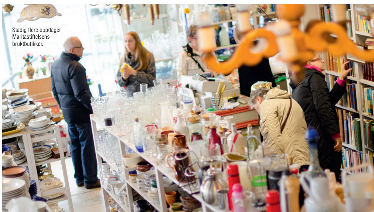
Stadig flere oppdager Maritastiftelsens bruktbu- tikker.

Prosjekt Ny karriere, som ble startet av Marita Women rett før nyttår 2010, har fungert meget bra. Vi har hatt 12 deltakere fra dette prosjektet