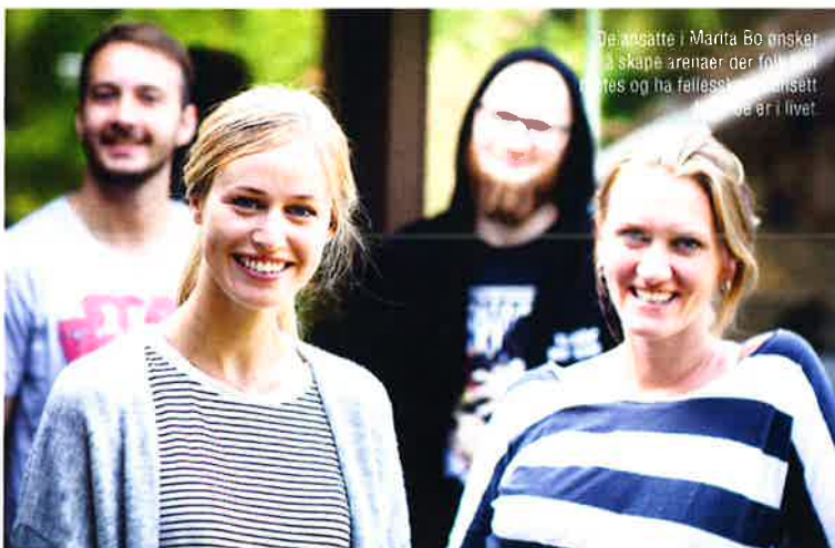
De ansatte i Marita Bo ønsker å skape arenaer der folk kan møtes og ha fellesskap. Ansattene er i livet.

Det er fem ansatt i Marita Bo, som utgjør 3,2 årsverk. Avd.leder sitter i en nettverksgruppe med andre som jobber med forebyggende tiltak rettet mot barn og unge i Oslo. Initiativ til gruppen ble tatt av gatepresten i Oslo, men er nå delegert videre til SALTO koordinator i sentrum av Oslo.